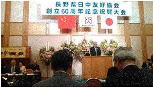
写真: 記念式典風景

長野県日中友好協会は1956年9月に創立し、今年で60周年を迎えました。これを記念して、去る10月12日長野市のホテル犀北館において、記念式典と祝賀レセプションが行われました。