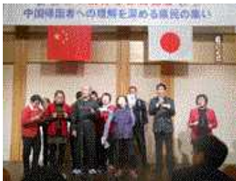
飯田市の皆さんの発表

飯伊からも帰国者の皆さんや日中友好協会関係者など総勢38名の参加がありました。こうした事業により帰国者の皆さんへの理解が深まり、安心して暮らせる地域づくりにつながることを期待します。